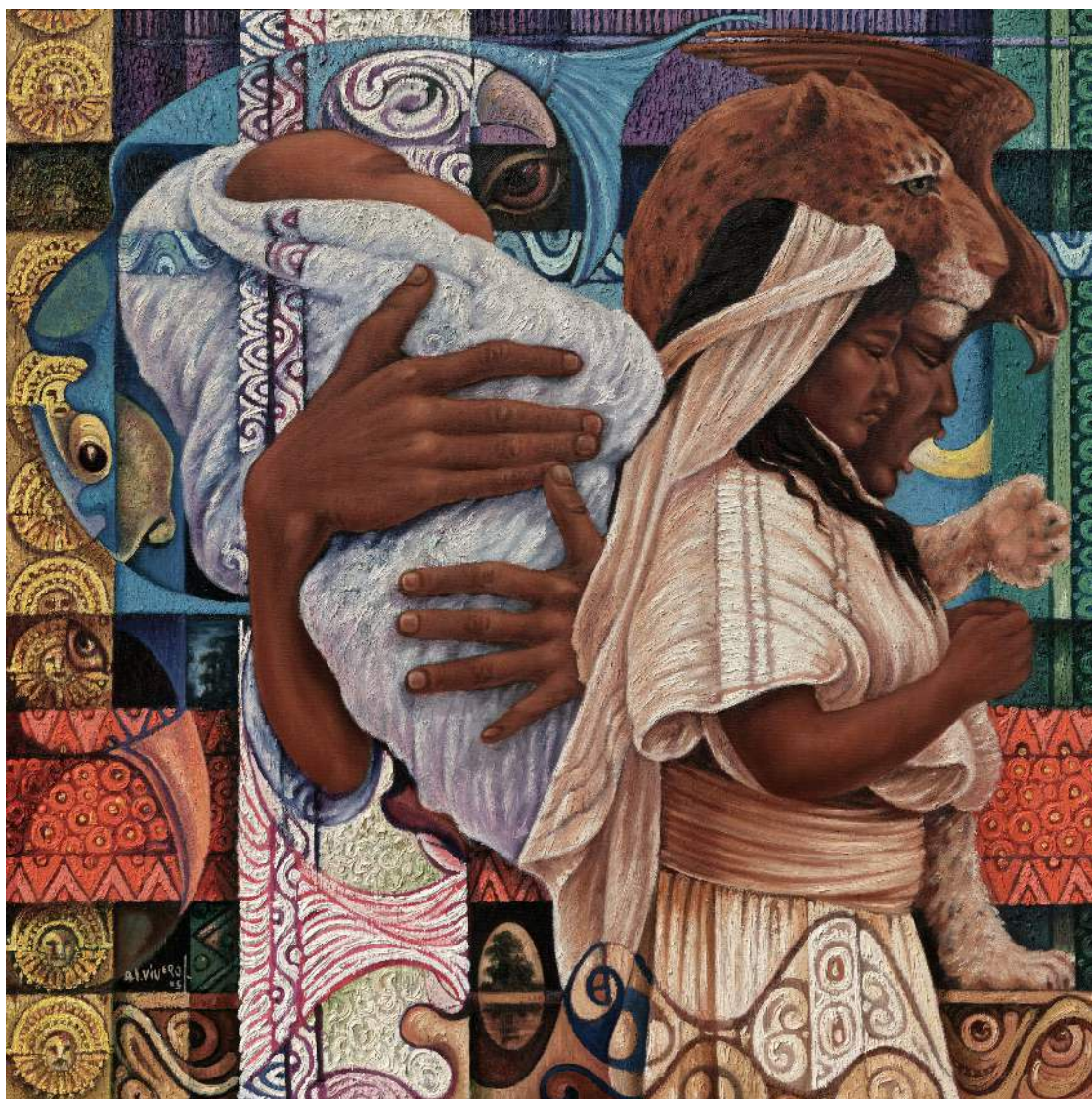
ALÚNA EN EL PRINCIPIO, Öl auf Leinwand - Al Vivero