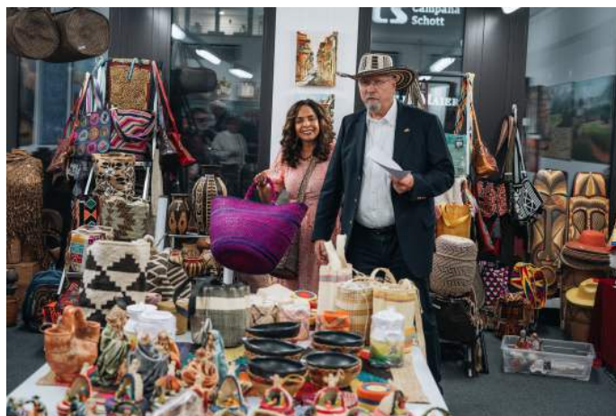
Kunstaussstellung - Juli 2024