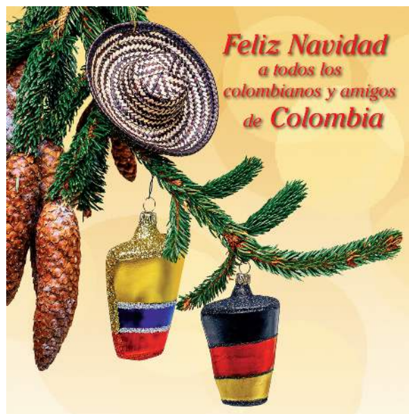
Christbaumkugeln aus Lauscha (Thüringen) und Sombbrero vuelteado aus Tuchín (Kolumbien)