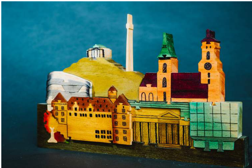
Ein Puzzle: von Stuttgart inspiriert, in Kolumbien kreiert